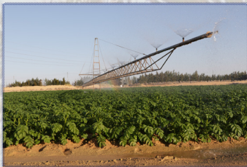
Vue d'un pivot d'irrigation, attendant à un ghout traditionnel, El Oued, Algérie