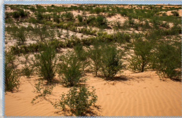
Revégétalisation des dunes côtières, Nouakchott, Mauritanie