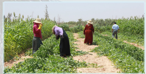
Périmètre irrigué, Médenine, Tunisie